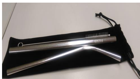
1. SUS316 不鏽鋼吸管一組。